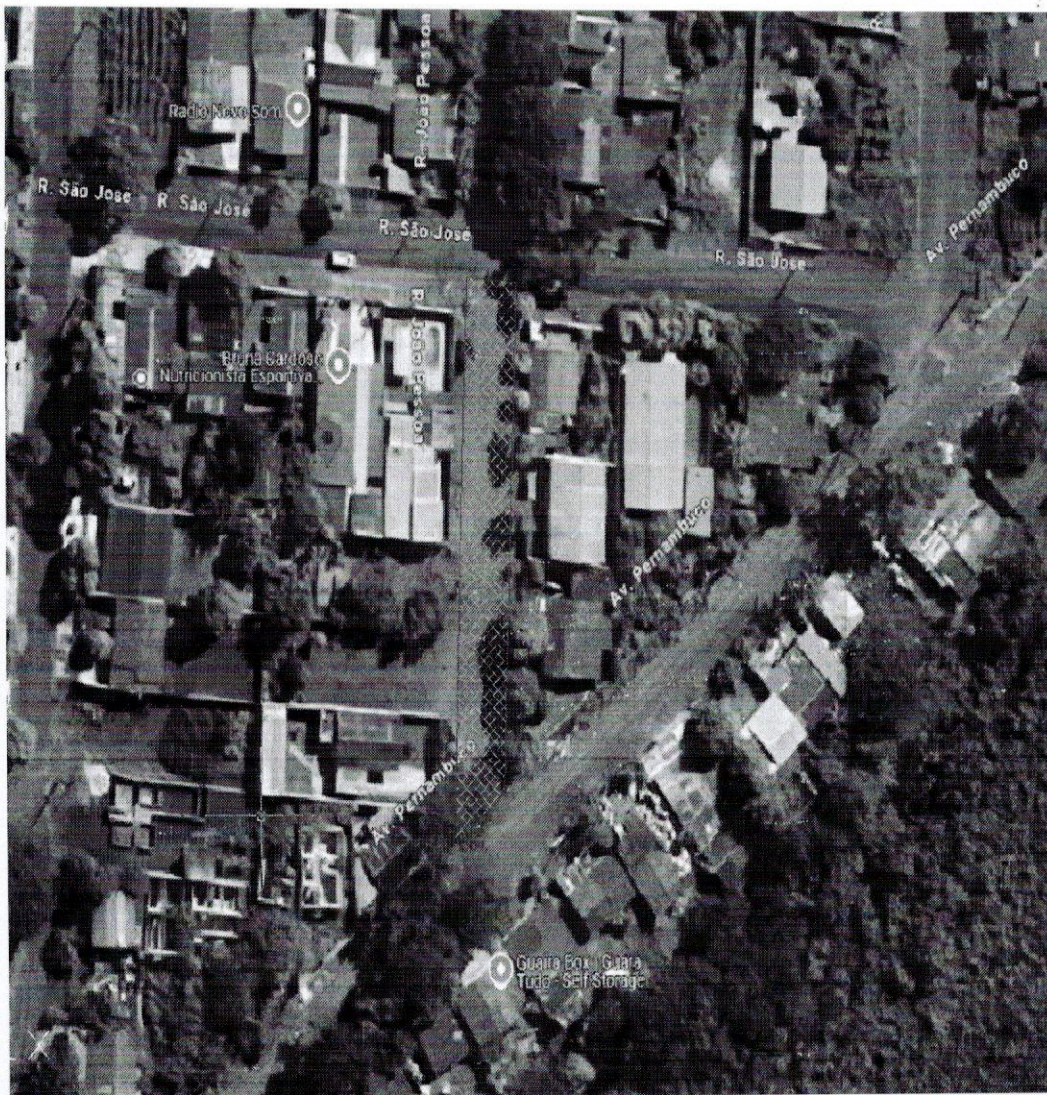
Imagem 1.1 – Bairro Parque Hortência, Rua João Pessoa – Sinalizado (Ultima quadra)!